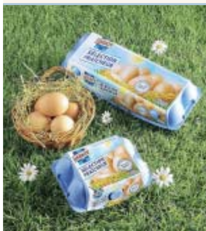
La boîte bleue "12 Sélection Fraîcheur" est la référence la plus vendue en France.